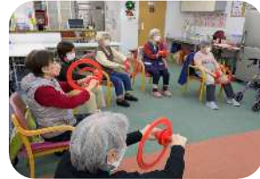
★ウラハンドは「脳と心と体」を「楽し く活性化」する心身機能活性療法の一つで す。バランスを取りながら輪っかを回す動 作ですが、練習するうちに出来るようにな ると良い笑顔がこぼれます。