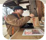
★2026年のあけびの輪スタートは、 曾根天満宮に初詣に参りました。 今年一年の無事と平安を祈願しました。