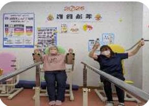
新年の幕開けは「温熱」から・・・ 新しい1年の始まりは、深部体温を温め る温熱療法からのスタートです。脳の働 きも良くして、意欲が満ちあふれる1年 でありますようにと、願いを込めて！