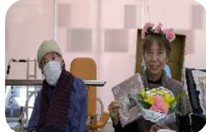
お誕生日 おめでと うござい ます。