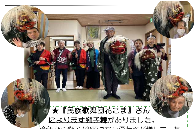
★『民族歌舞団花こま』さん によります獅子舞がありました。 今年から獅子が2頭になり勇壮さが増しました。 厄除け・無病息災を祈願していただきました。