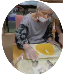
型抜きのコッキーと ロイヤルミルクティ